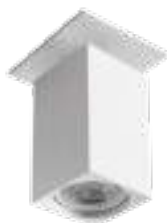
CHIRO GU10 DTL-W