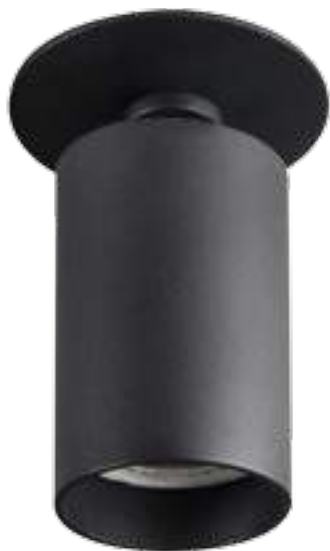
CHIRO GU10 DTL-B