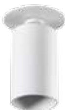
CHIRO GU10 DTO-W