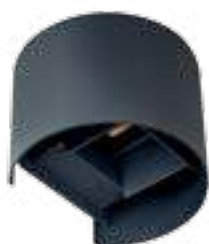
REKA LED EL 7W-O-GR