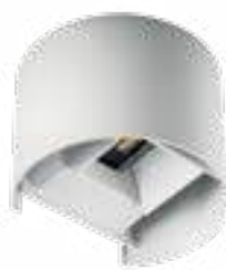
REKA LED EL 7W-O-W