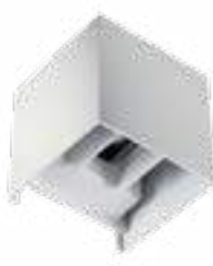
REKA LED EL 7W-L-W