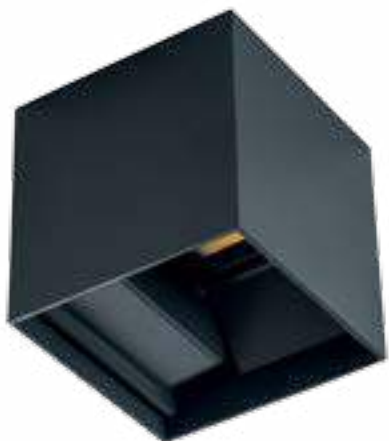
REKA LED EL 7W-L-GR