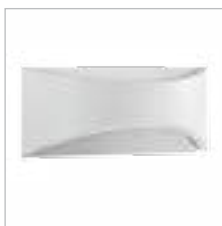
BISO LED EL 8W-W