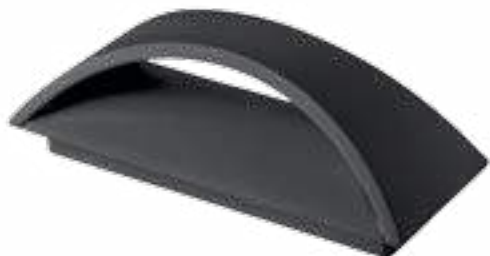
BISO LED EL 8W-GR