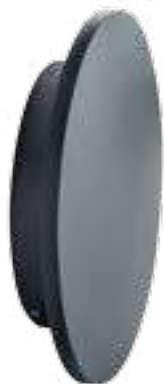
FORRO LED EL 8W-GR