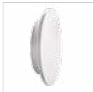
FORRO LED EL 8W-W