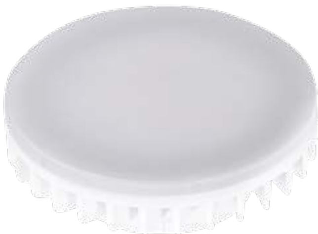
ESG LED 9W GX53