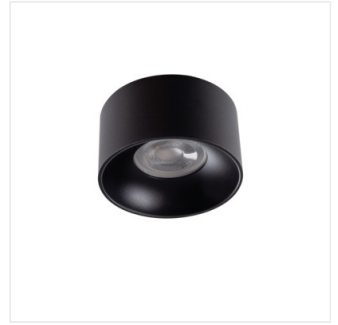
MINI RITI GU10 B/B