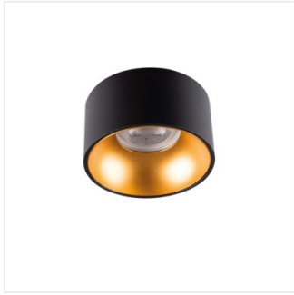
MINI RITI GU10 B/G