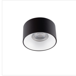
MINI RITI GU10 B/W