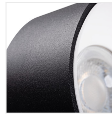
MINI RITI GU10 B/G