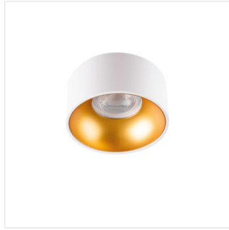
MINI RITI GU10 W/G