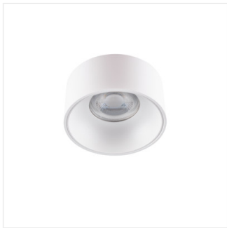
MINI RITI GU10 W/W